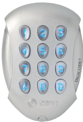
TM/GALEO Extra knappsats